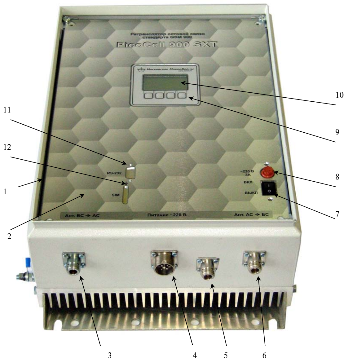
Рис.1 Ретранслятор PicoCell 900 SXT

Вся информация, необходимая при настройке систем при монтаже и при дальнейшем обслуживании, отображается на графическом ЖК-дисплее, расположенном на корпусе ретранслятора. Настройка производится с клавиатуры, расположенной под дисплеем, с помощью русскоязычного меню.